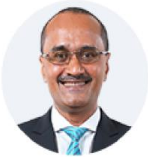
Ketua Pegawai Perniagaan Bank Simpanan Nasional Merangkap Penasihat KOBANAS Berhad

Assalamualaikum W.B.T dan Salam Sejahtera,