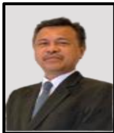
JAMSARI@RIDZUAN MOHD NOOR SETIAUSAHA