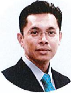
Ketua Eksekutif Bank Simpanan Nasional Merangkap Penaung KOBANAS Berhad

Assalamualaikum W.B.T dan Salam Sejahtera,