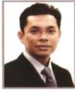
Ketua Pegawai Kewangan Bank Simpanan Nasional Merangkap Penasihat KOBANAS Berhad