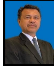
JAMSARI@RIDZUAN MOHD NOOR ALK