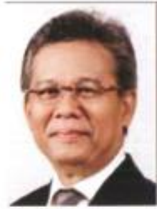
Ketua Eksekutif Bank Simpanan Nasional Merangkap Penaung KOBANAS